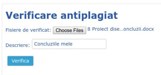
Fig.1 Interfața programului antiplagiat

5.5. După apăsarea butonului Verifică, documentele selectate vor fi verificate, rezultatul fiind Raportul antiplagiat (Fig. 2) care va și afișat pe pagina ADL și trimis prin e-mail solicitantului.