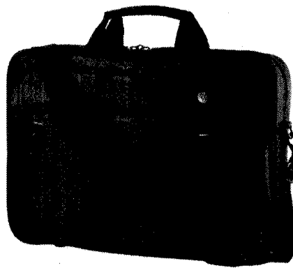
Figura 2 Imagine orientativă geantă laptop