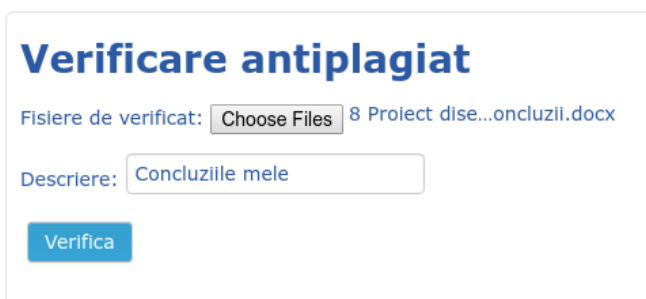
Fig.1 Interfața programului antiplagiat

5.5. După apăsarea butonului Verifică, documentele selectate vor fi verificate, rezultatul fiind Raportul antiplagiat (Fig. 2) care va și afișat pe pagina ADL și trimis prin e-mail solicitantului.